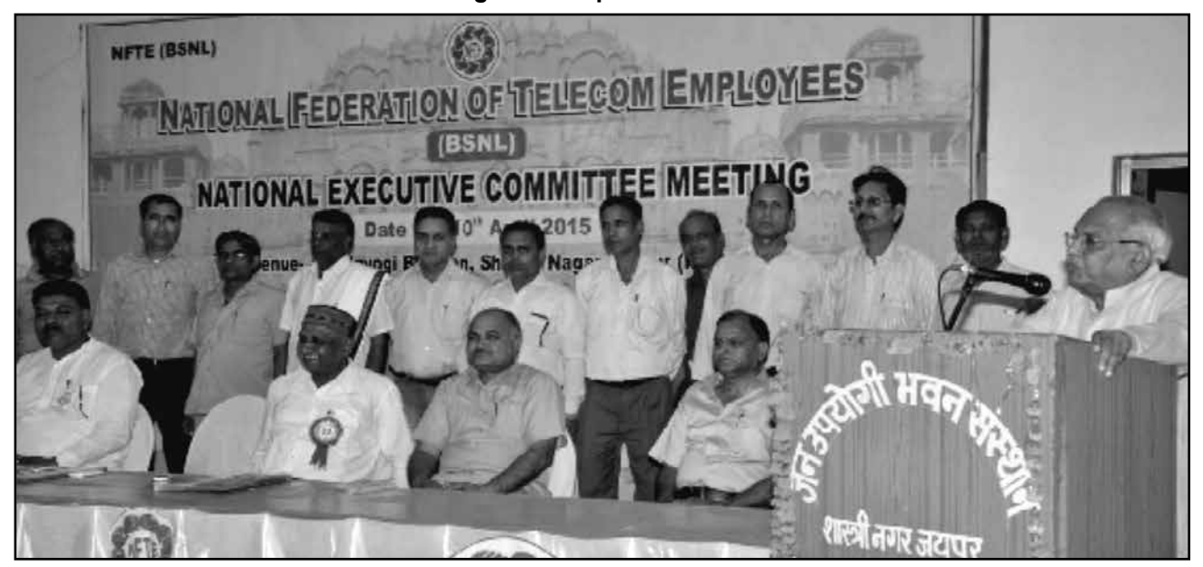
President addreassing the opening session

cial crisis. Instead of extending help to the PSU the DOT officers are treating the BSNL as captive and dictating terms without discharging their own responsibilities in respect of the company. The union after deliberations decided to implement two days strike call of 21<sup>st</sup> and 22<sup>nd</sup> April whole heartedly against high handedness of Ministry of Telecom.